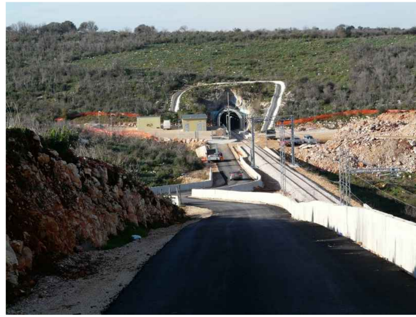
1 - Viabilità di emergenza secondaria