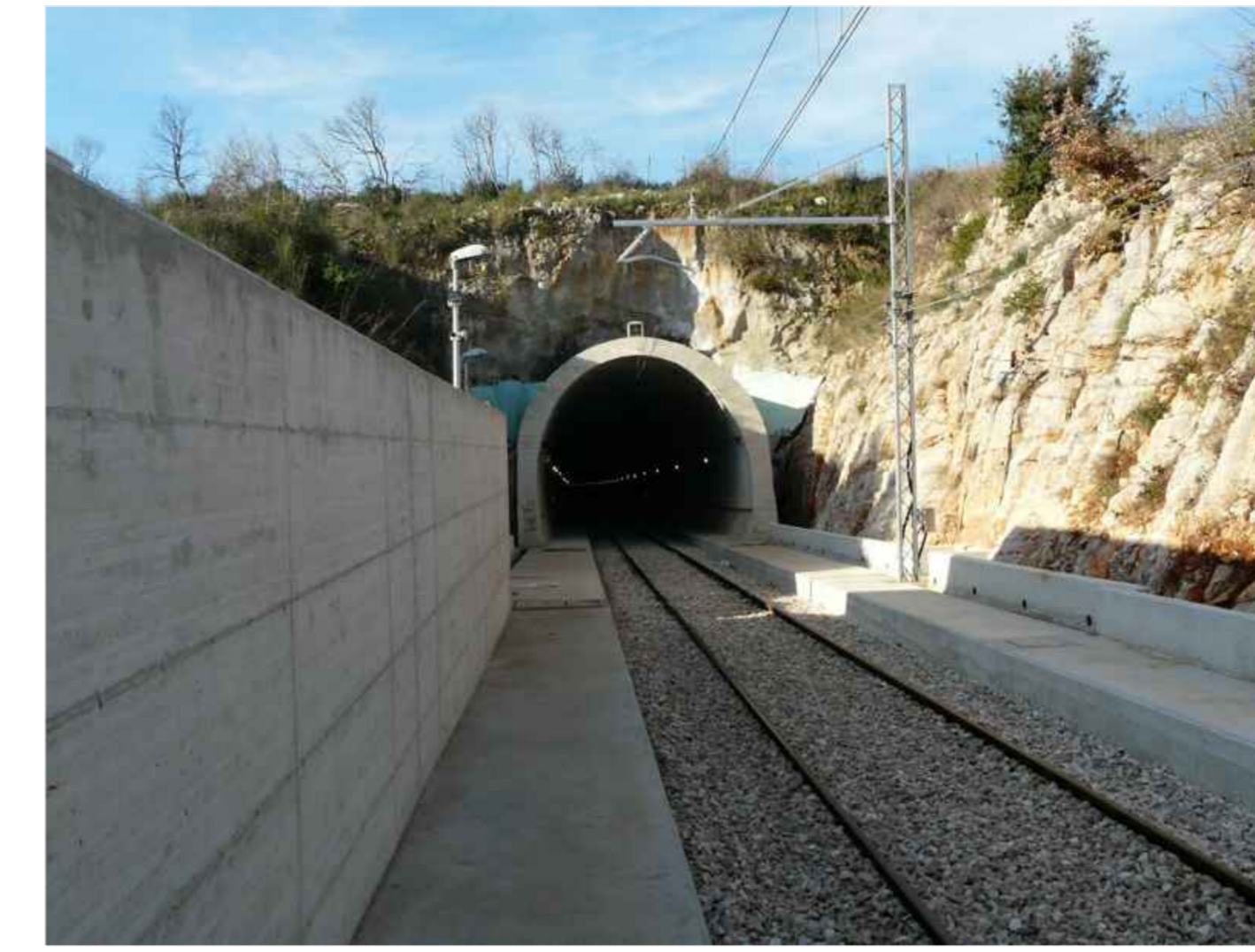
9 - Ingresso galleria km 19+ 478