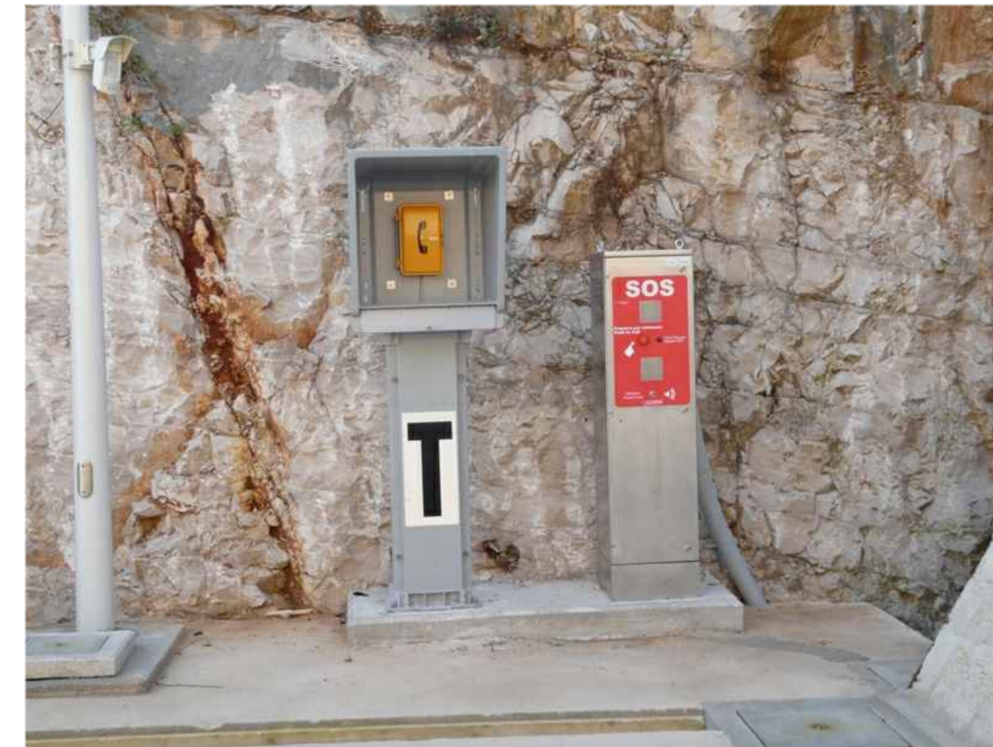
8 - Telefono stagno di servizio / Colonna SOS