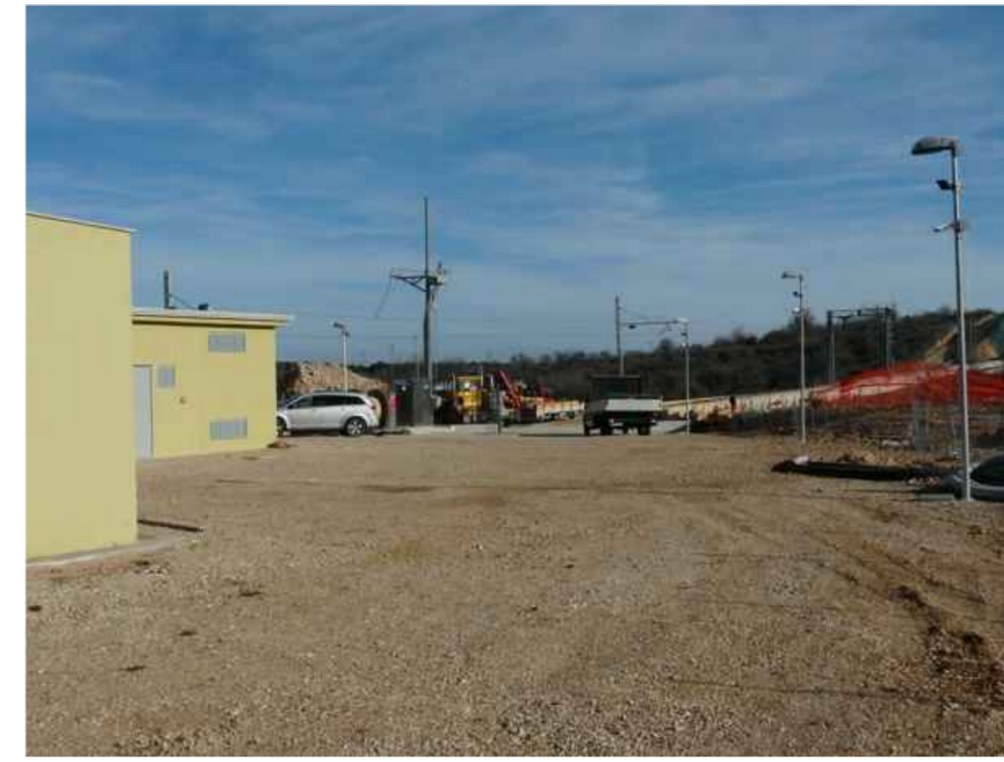
3 - 4 - 5 Posto Medico Avanzato / Area raccolta viaggiatori Area dislocamento mezzi di soccorso sanitario