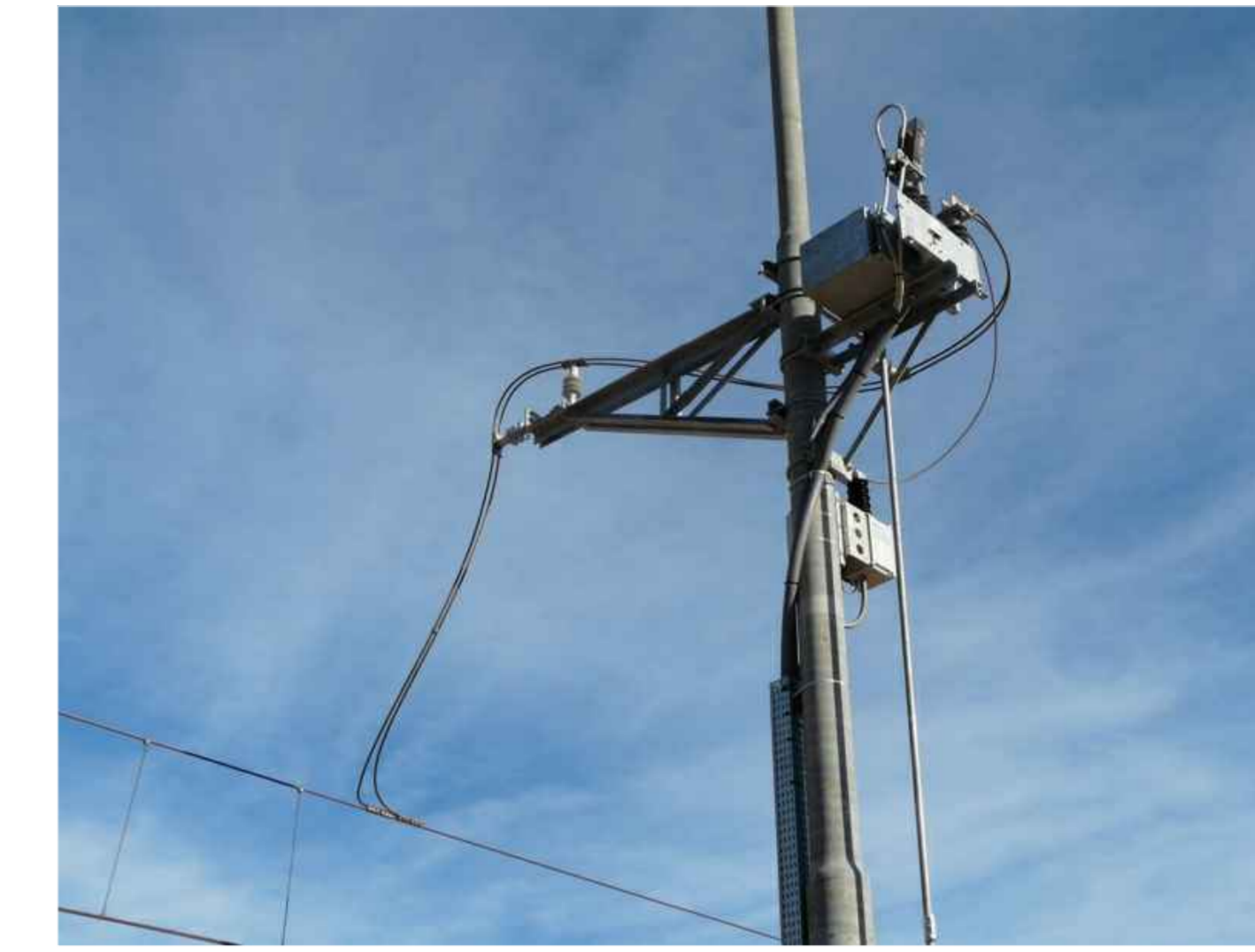
14 - Impianto di messa a terra / Sezionatore