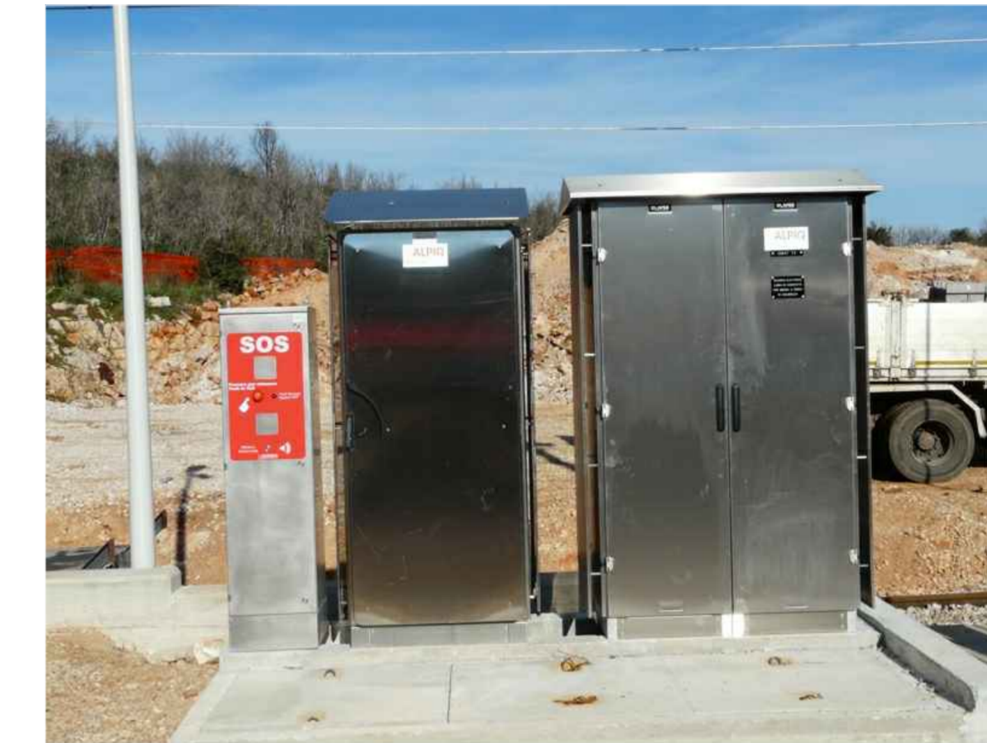
15 - Colonna SOS e quadro elettrico disalimentazione linea elettrica