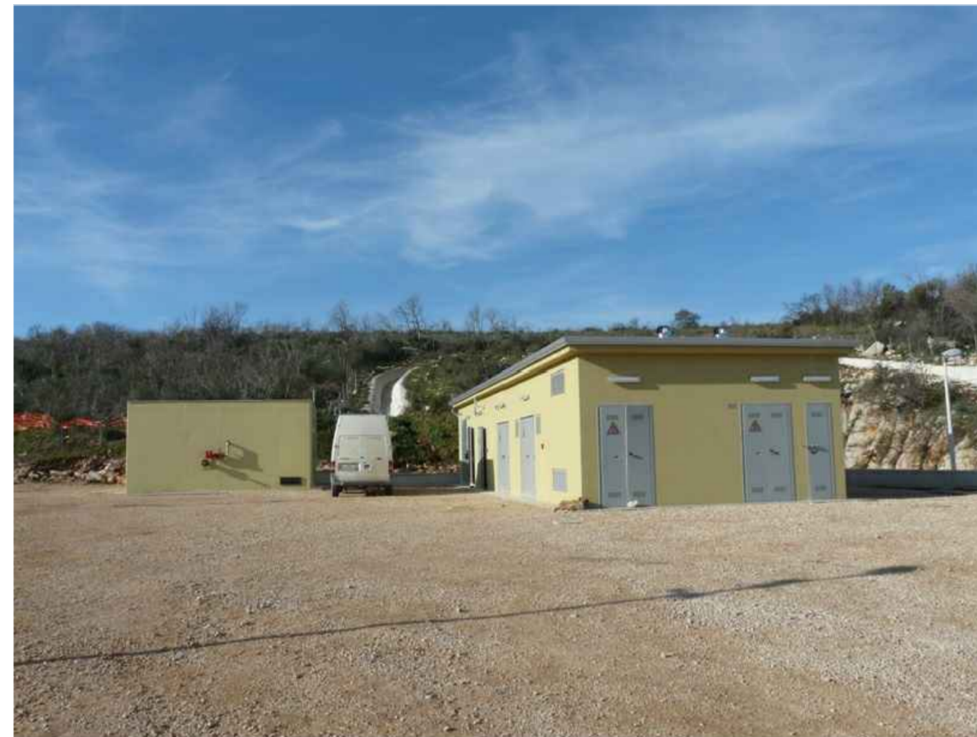
2 - Area di triage