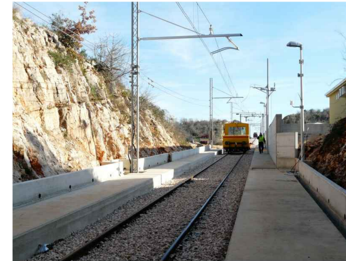
10 - 11 Viabilità di soccorso / Esodo pedonale viaggiatori e operatori sanitari 118 / Forze dell'Ordine e personale FdG